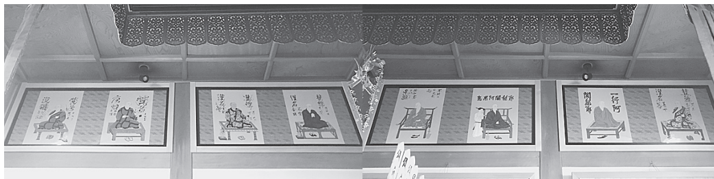
龍猛 龍智 金剛智 不空 弘法大師 恵果 一行 善無畏

お大師さまは、毎日欠かすことなく縁のある各地の遺跡に姿を現して人々のことを見守っていただいています。