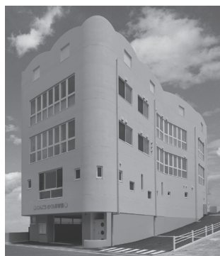
こんごうさくら保育園 (安芸郡府中町茂陰2丁目)