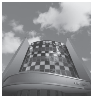
こんごう保育園 (安芸郡府中町浜田2丁目)

お近くにお越しの際は、是非お立ち寄り下さい。 ◎尚、私達と一緒に働いて下さる方を募集しています。 詳細は、お寺(〇八二―二八二―五六六二)までお問い合わせ下さい。